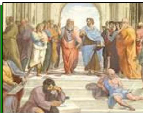
Détail de « L'Ecole d'Athènes » de Raphaël

Ne dit-on pas : « à toute chose malheur est bon » Et de saisir l'occasion de se découvrir de nouvelles passions Du sport, de l'art à la culture en passant par le bri- colage La maladie révèle souvent de nouvelles aptitudes quel que soit l'âge